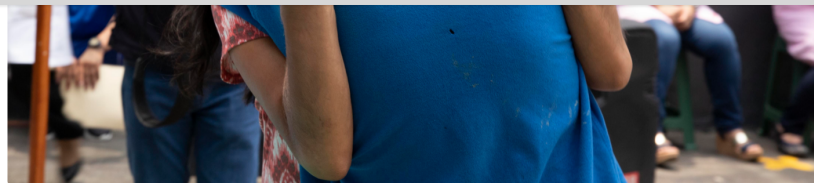
• Por primera vez se conceden en bloque 19 de estos beneficios, en el Distrito Judicial de Cuautitlán.